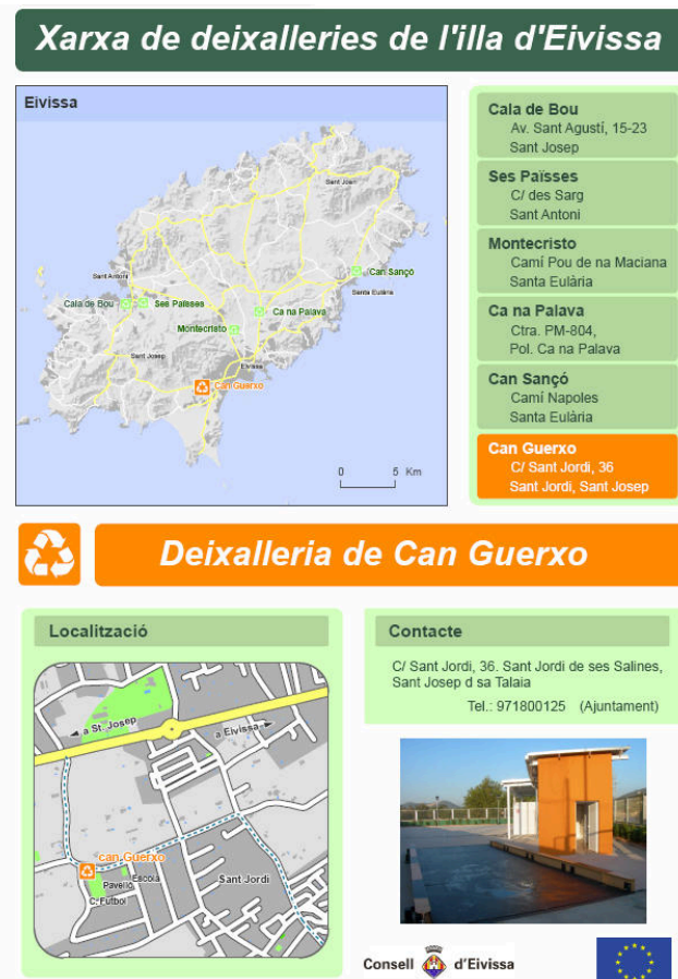
Ejemplo de fichas informativas