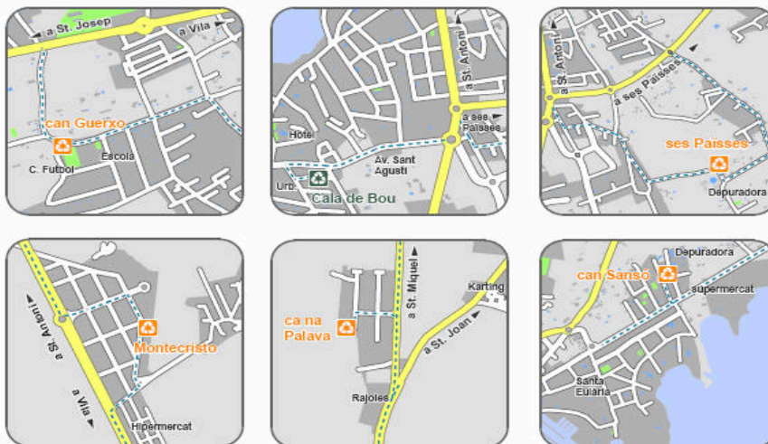
Mapa de localización de los puntos limpios y mapas de detalle

Para los puntos móviles se desarrolla un calendario donde queda reflejado cada día de la semana el sitio y el horario donde darán el servicio las unidades móviles.