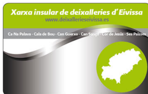
Imagen de la tarjeta de usuario

Este proyecto contribuye a reducir las disparidades sociales y económicas entre los ciudadanos de la Unión Europea, ya que antes de su construcción no existía una alternativa de gestión ambientalmente correcta para algunos de estos tipos de residuos.